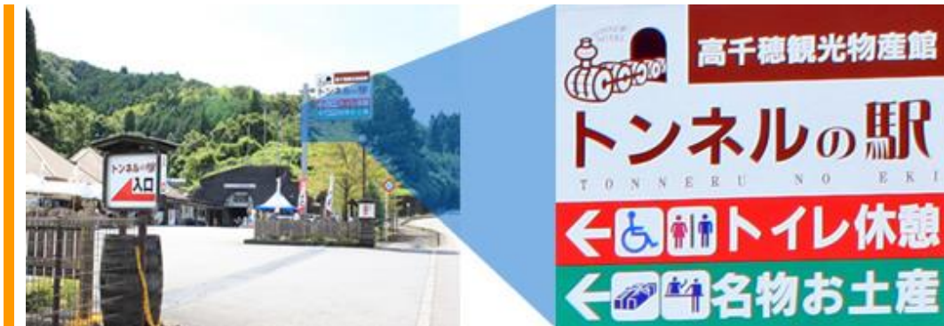
高千穂トンネルの駅に到着 [17から約9km 15分]