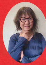
大林千菜 ちくみ 莩