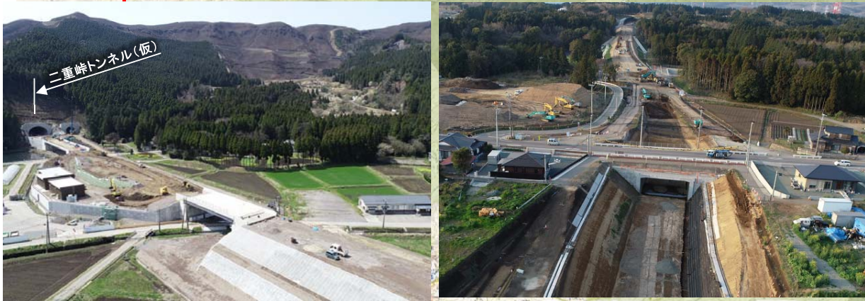
①阿蘇側坑口付近(R2. 4. 2撮影)