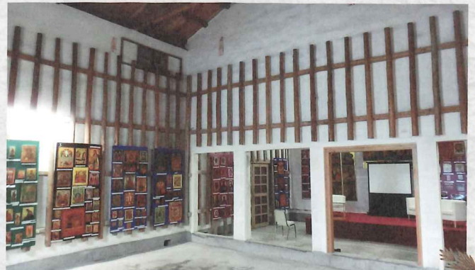
竹田キリシタンホール内観

ご来場の方には、中九州自動車道 竹田IC開通を記念し、おトクに城下町の 食べ歩きを楽しめる「ふらりひとつまみ」クーポンと 「竹田温泉 花水月」入浴券を差し上げます。