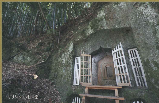
キリシタン礼拝堂

来場者には、「ふらりひとつまみ」クーポンと「竹田温泉 花水月」入浴券を差し上げます。