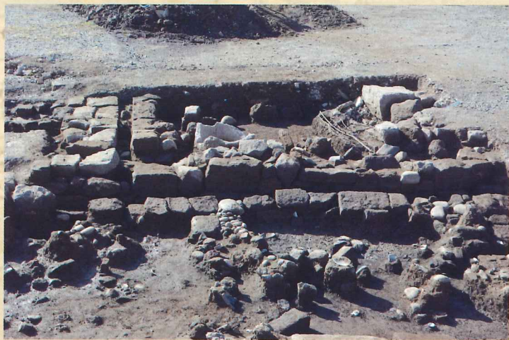
加島屋・宮津屋境排水溝