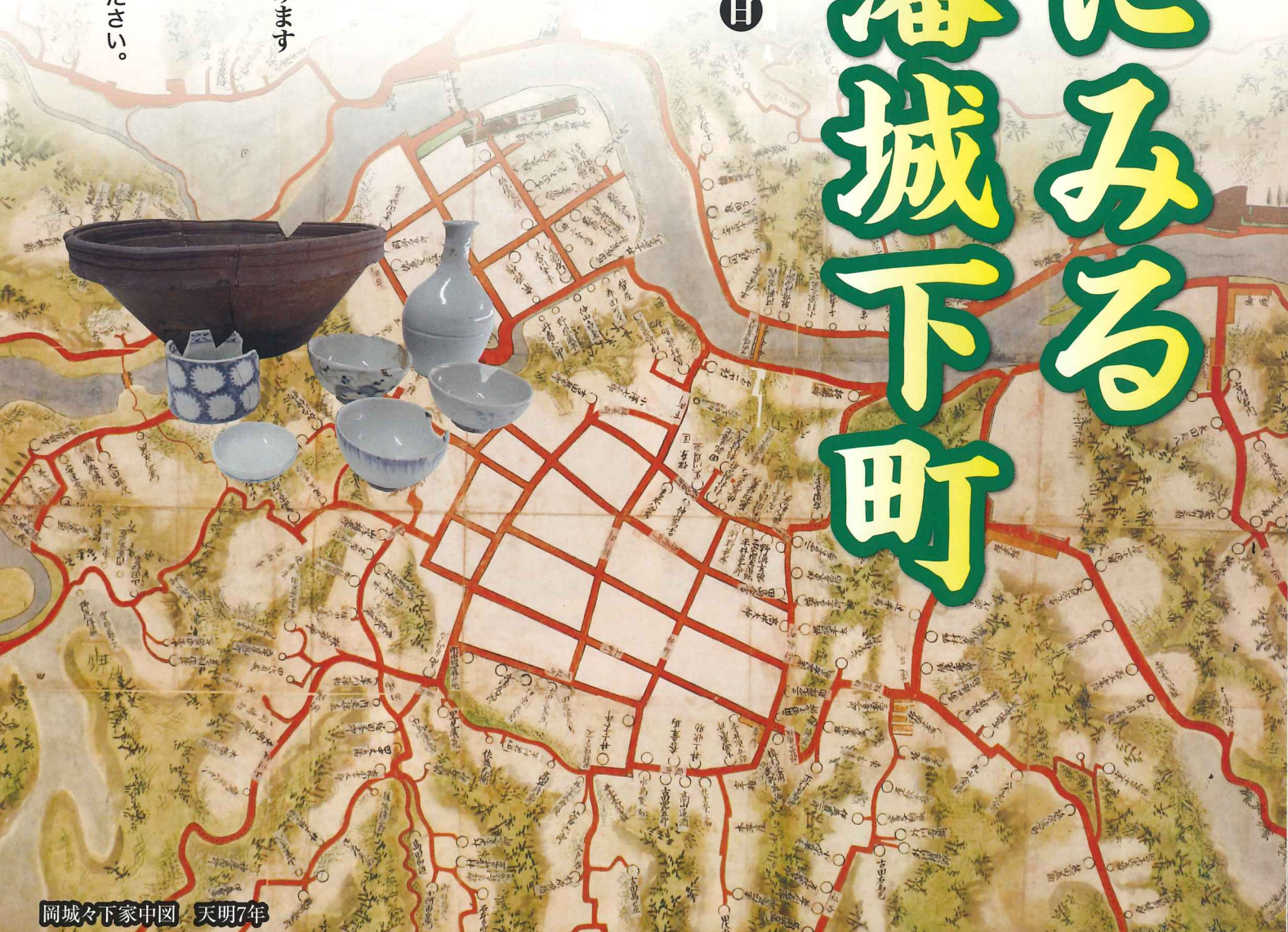
岡藩城下町家中国 天明7年

新型コロナウイルス感染症予防のため、マスクを着用してご入館ください。 発熱や風邪の症状のある方は来館をご遠慮ください。