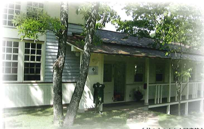
[ 林の中の小さな図書館 ]