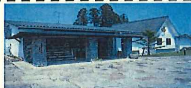
この外観の建物です