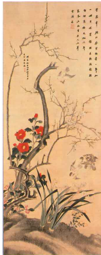
田能村竹田「四季花鳥図（第1図）」 文化6年（1809）大分市美術館蔵 【展示期間】11/25～12/18