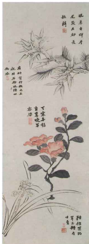
田能村竹田「花卉図（第1図）」 文化5年（1808）大分市美術館蔵 【展示期間】10/29～11/23

本展では、田能村竹田が花々を描いた重要文化財の名品を「里帰り展示」とともに、大分の画家たちが描いた春夏秋冬の花鳥図等、多彩な作品約40点をご紹介します。