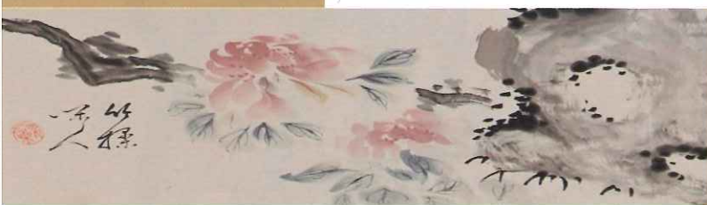
佐久間竹浦「富貴天香図」 大正7年（1918）竹田市歴史文化館蔵