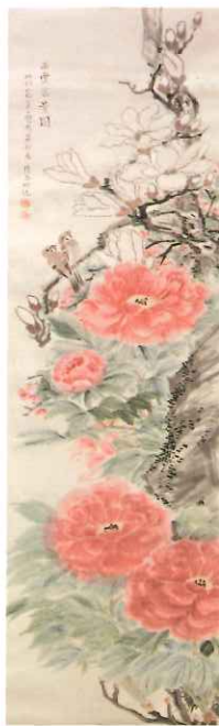
草刈樵谷「玉堂富貴図」 昭和40年（1965） 大塚義章コレクション