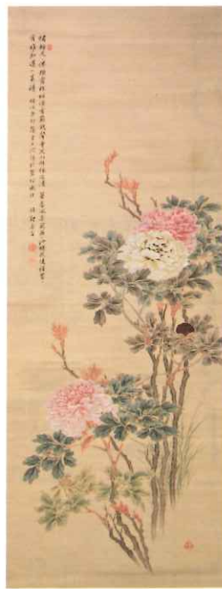
田近竹邨「花卉図」 明治36年（1903） 大塚義章コレクション