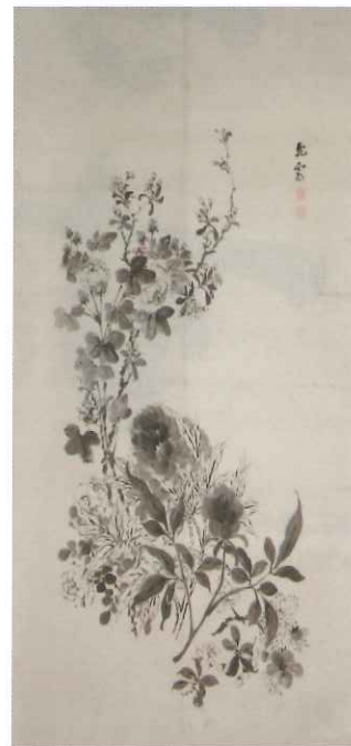
賀来飛霞「花卉図」 明治前期頃 大分県立美術館蔵

新型コロナウイルス感染予防のため、マスクを着用してご入館ください。 発熱や風邪の症状のある方は来館をご遠慮ください。