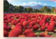
9月下旬~11月上旬 コキア