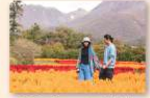
9月下旬~11月上旬 ケイトウ