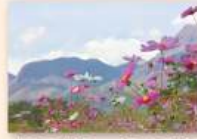
10月上旬~10月下旬 コスモス 9月~11月 センニチコウ、ペコニア