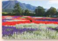
9月中旬~11月中旬 サルビア

黄金色に輝くマリーゴールド、鮮やかな赤や黄色のケイトウ、風に揺られるコスモス、紅のコキア、赤や白、青の鮮やかなコントラストが印象的なサルビアなど、色とりどりの花々が咲き誇り、大自然に溶け込んだ色彩のじゅうたんが目前に広がります。