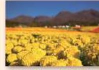
9月下旬~11月上旬 アフリカンマリーゴールド