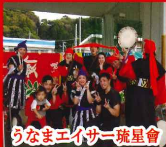
うなまエイサー琉星會