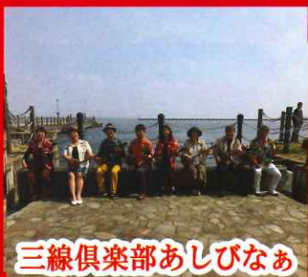
三線俱樂部あしびなあ