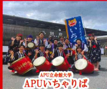
APU立命館大学 APUいちやりば