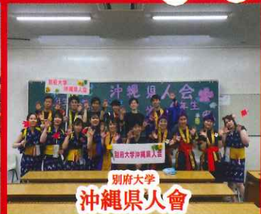
別府大学 沖縄県火會