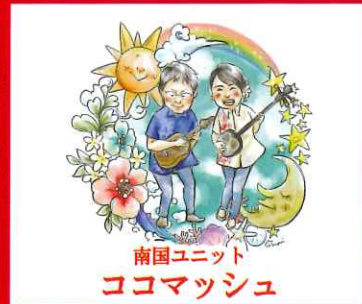
南国ユニット ココマッシュ