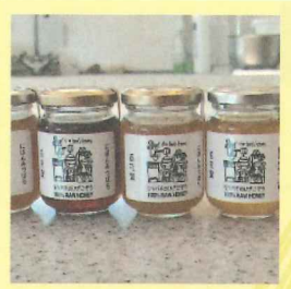
ミツバチのひざこぞう 夏蜜の食べ比べと販売会