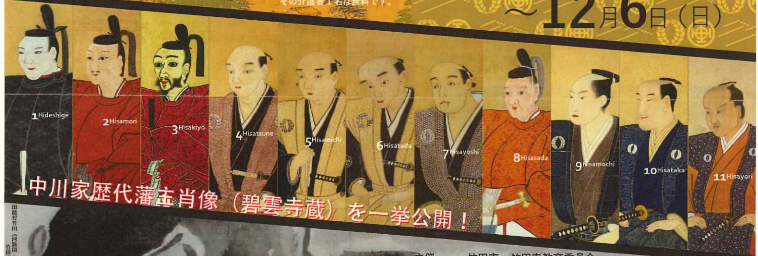
中川家歴代藩主肖像（碧雲寺蔵）を一挙公開！

主催 竹田市 竹田市教育委員会 特別協力 大分県立美術館 大分県立先哲史料館 碧雲寺 願成院（愛染堂） 大分合同新聞社 NHK大分放送局 大分放送 テレビ大分 大分朝日放送 J:COM 大分ケーブルテレコム 後援