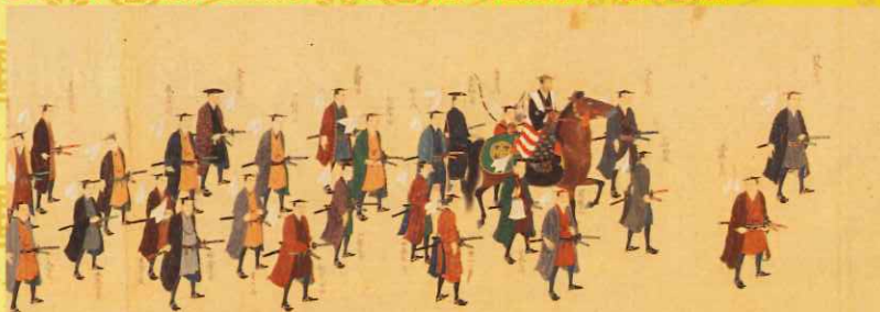
淵野真斎ほか《三宅山御鹿狩絵巻（部分）》1824 県指定 竹田市歴史文化館蔵

初日と二日目、計2,763人が登場。 全16巻、総延長約270mからなる超大作。今回はその一部を公開。