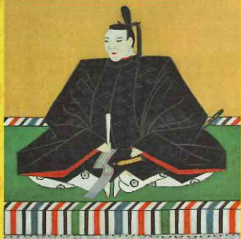
《初代岡藩主 中川秀成肖像》県指定 碧雲寺蔵