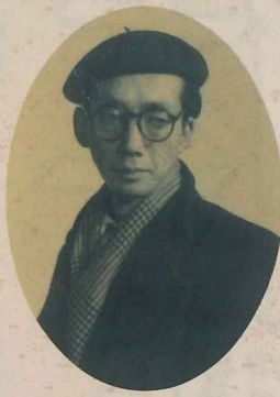
佐藤義美 (1905 ~ 1968)

いぬのおまわりさん まいごの まいごの こねこちゃん あなたの おうちはどこですか おうちを さいても わからない なまえを さいても わからない にゃん にゃん にゃん にゃん にゃん にゃん にゃん にゃん ないてばかりいる こねこちゃん いぬのおまわりさん こねこちゃん こまっちゃまって わん わん わん わん わん わん わん わん わん わん わん わん