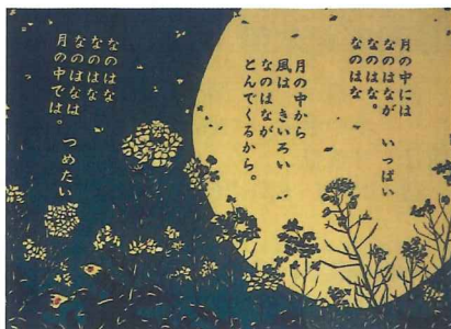
木版画・川野和男

織細な彫りで描かれた佐藤義美の子ども心を彷彿させられるような木版画と、可愛らしく色鮮やかな押し花で表現された義美作品の世界を約 50 点の作品で紹介しします。