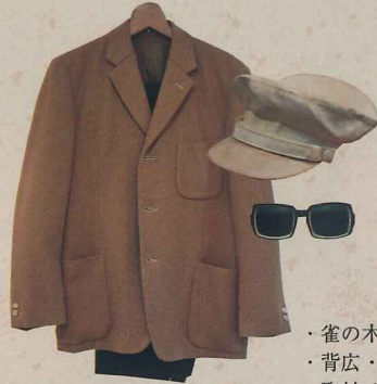
・雀の木 ・背広・帽子・サングラス ・取材ノート