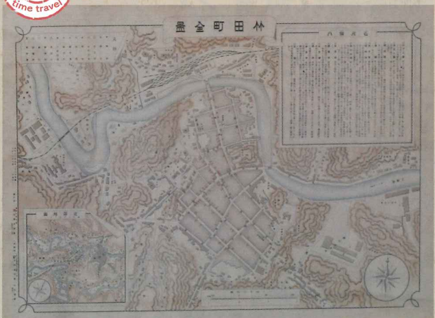
「竹田町全図」 大正13年

観光の拠点となる豊肥線の「豊後竹田駅」が開設したのは大正13年(1924)。列車の発着にあわせて乗合自動車の便も整えられ、竹田を拠点に各方面に路線が延びていきました。大正から昭和初期にかけて、本格的に交通手段が整備され利便性が良くなり、手軽に小旅行を楽しめる状況が生まれました。カメラが高価で今のようにスマートフォンやインターネットが無い時代、旅行の思い出を持ち帰るのに最適なおみやげ品が「絵葉書」でした。今回の展示では、その絵葉書や地図などを通して、明治・大正・昭和初期の「竹田」を当時の人々がどのような旅をしていたのか、紹介します。