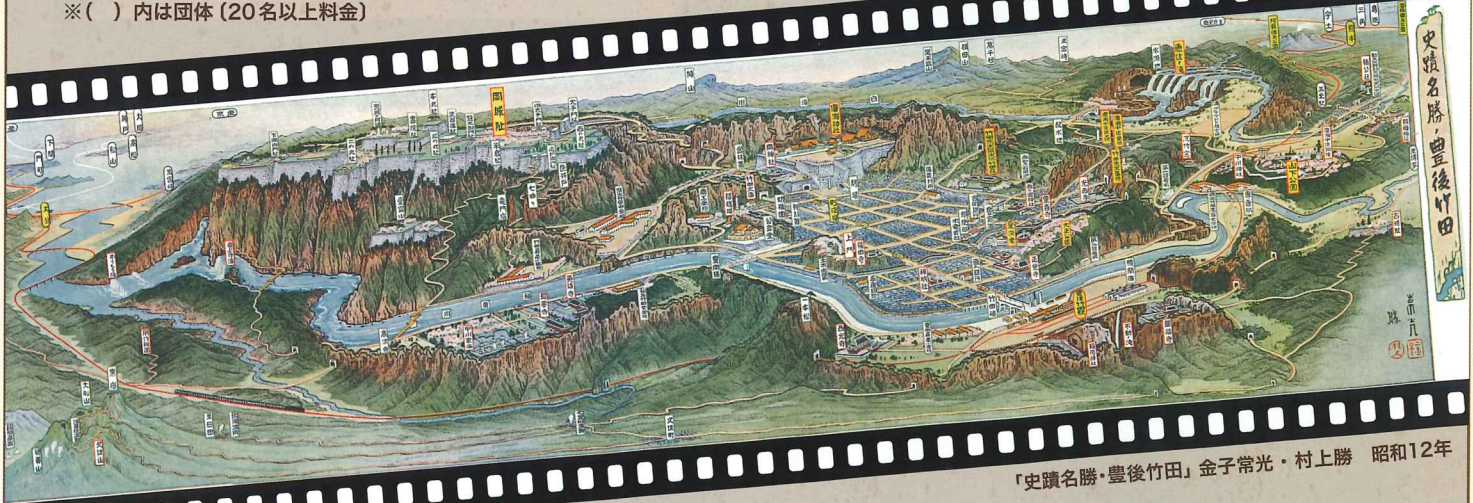
「史蹟名勝・豊後竹田」金子常光・村上勝 昭和12年

※上記金額は国指定史跡旧竹田荘の観覧料を含みます。 ※岡城ガイダンスセンターと市民ギャラリーは観覧無料。 ※( )内は団体(20名以上料金)