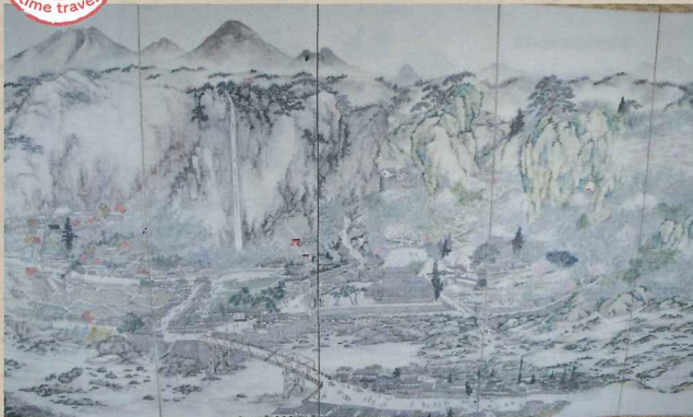
「落門の滝 四季真景図」 佐久間竹浦 大正13年